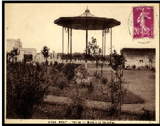
Le kiosque à musique

Retrouvez ces photos, puis écrivez sous chacune d'elle ce qu'elle représente.