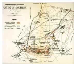
Doc 2 Un espace en peau de léopard