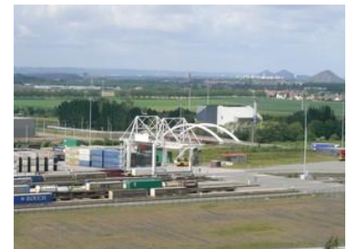
Doc 6 Entre le noir et le vert