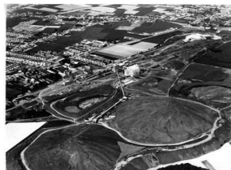
Doc 5 Les terrils du pays noir