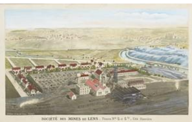
Doc 4 La fosse 5 de Lens reconstruite