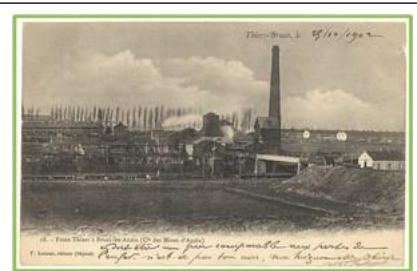
Doc 3 Les portes de l'enfer