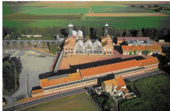
Luftaufnahme des Centre Historique Minier

Das Centre Historique Minier wird 1982 gegründet und beinhaltet drei sich ergänzende Strukturen: ein Bergbaumuseum, ein Archiv- und Dokumentationsressourcen-Zentrum und ein Zentrum für wissenschaftliche Energiekultur (CCSE). Der Standort wird zwei Jahre später, im Mai 1984, eröffnet und in diesem Jahr von 17 594 Besuchern besichtigt.