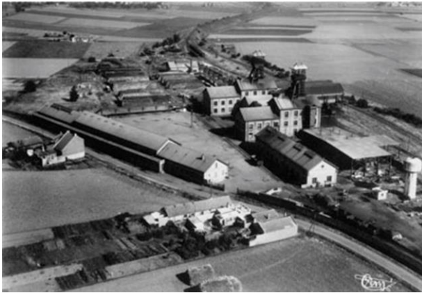
Luftaufnahme der Grube Delloye um 1950-60

Die Grube Delloye der einstigen Bergbaugesellschaft Aniche wird 1931 in Betrieb genommen. In diesem Jahr werden 18 634 Tonnen Kohle gefördert. Der Rekord wird 1963 mit 1 218 Tonnen pro Tag erreicht. Das Vorkommen ist schwierig zu nutzen, verliert an Rentabilität und der Betrieb wird 1971 eingestellt .