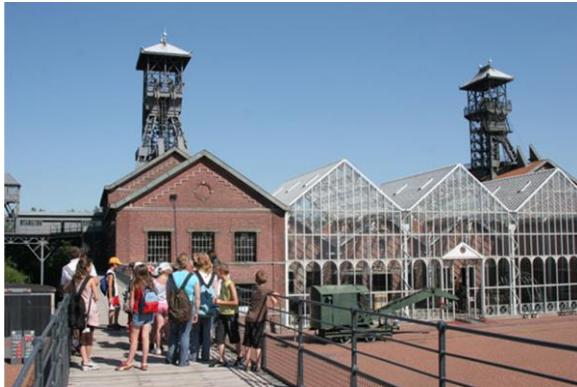
Der Standort von der Brücke aus

Das Centre Historique Minier befindet sich mitten im Bergbaugesamt, 8 km östlich von Douai in Nord. Es ist auf dem Gelände der ehemaligen Grube Delloye untergebracht, auf dem sich 8 000 m 2 Industriegebäude und Aufbauten über 8 Hektaren verteilen. Das Zentrum, eine wichtige Stätte im Bergbau-Gebiet, das als UNESCO-Welterbe eingetragen ist, wird als historisches Denkmal klassiert.