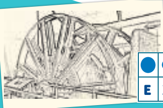
La machine d'

Dirigez-vous en salle 21 pour découvrir le nom des trois éléments utiles à Stanislas.