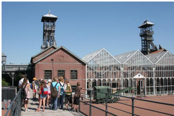
Vue du site depuis la passerelle

Situé à Lewarde, à 8 km à l'est de Douai dans le Nord, le Centre Historique Minier se trouve au cœur du Bassin minier. Il est installé sur le carreau de l'ancienne fosse Delloye qui regroupe 8 000 m 2 de bâtiments industriels et de superstructures, sur un site de 8 hectares. Il est classé Monument historique depuis 2009 et constitue l'un des sites remarquables du Bassin minier inscrit au patrimoine mondial de l'Unesco en 2012.