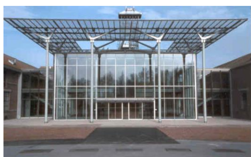
Bâtiment d'accueil

En 1994, le Centre accueille son millionième visiteur . Les activités continuent à se développer avec le lancement d'une collection d'ouvrages consacrés à la mine sous le nom Mémoires de Gaillette dont la première publication en 1995 s'intitule Du coron à la cité, un siècle d'habitat minier dans le Nord/Pas-de-Calais, 1850 – 1950 . C'est le début d'une politique éditoriale. En 1997 , les rencontres patoisantes QuoQuiDi sont proposées pour la première fois, puis deviennent bisannuelles.