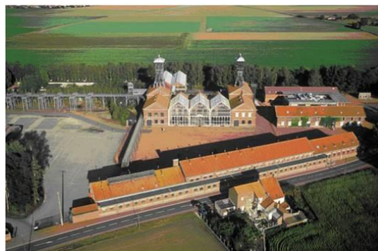
Vue aérienne du Centre Historique Minier

Créé en juillet 1982, le Centre Historique Minier est composé de trois structures complémentaires : un musée de la mine, un centre d'archives et de ressources documentaires et un centre de culture scientifique de l'énergie (CCSE). Le site, qui ouvre deux ans plus tard en mai 1984, accueille 17 594 visiteurs cette année-là.