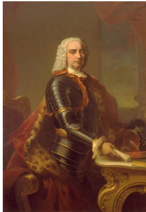
Jacques Desandrouin

La véritable histoire du bassin minier commence avec Jacques Desandrouin qui, en 1716, entreprend des recherches dans la région de Valenciennes, prolongement naturel du riche gisement houiller déjà en exploitation à cette époque en Wallonie, région que la France vient de perdre au traité d'Utrecht en 1713. Après une vingtaine d'années de laborieux forages, il trouve à Anzin, le 24 juin 1734, une importante veine de charbon gras d'excellente qualité.