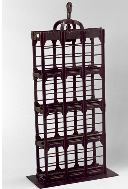
Maquette de cage à quatre étages, prenant modèle sur celle de la fosse 6 d'Haillicourt des mines de Bruay, fabricant MALISSARD-TAZA, bois, cuivre, métal, H. 70 x 34 x 16 cm, n° inv. 1974.151