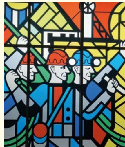
Création d'un nouvel homme (détail), Roman Minin