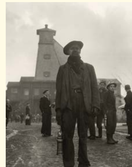
Mineur, Billy-Montigny (Pas-de-Calais), 1951, Willy Ronis