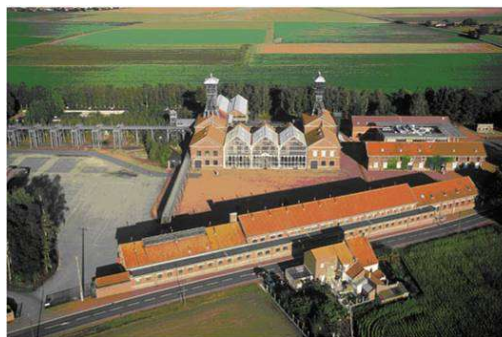
Vue aérienne du Centre Historique Minier

Créé en juillet 1982, le Centre Historique Minier est composé de trois structures complémentaires : un musée de la mine, un centre d'archives et de ressources documentaires et un centre de culture scientifique de l'énergie (CCSE). Le site, qui ouvre deux ans plus tard en mai 1984, accueille 17 594 visiteurs cette année-là.