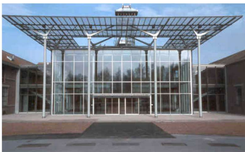
Bâtiment d'accueil

En 1994, le Centre accueille son millionième visiteur . Les activités continuent à se développer avec le lancement d'une collection d'ouvrages consacrés à la mine sous le nom Mémoires de Gaillette dont la première publication en 1995 s'intitule Du coron à la cité, un siècle d'habitat minier dans le Nord/Pas-de-Calais, 1850 – 1950 . C'est le début d'une politique éditoriale. En 1997 , les rencontres patoisantes QuoQuiDi sont proposées pour la première fois, puis deviennent bisannuelles.