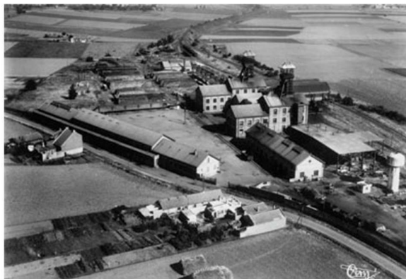
Vue aérienne de la fosse Delloye, vers 1950-60

La fosse Delloye, de l'ancienne Compagnie des Mines d'Aniche, commence son activité en 1931. Cette année-là sont extraites 18 634 tonnes de charbon. Le record de tonnage est atteint en 1963, avec 1 218 tonnes extraites par jour. Difficile à exploiter, le gisement devient peu rentable et l'exploitation s'arrête en 1971.