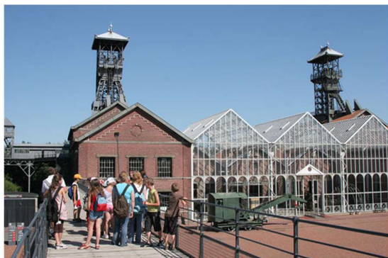
Vue du site depuis la passerelle

Situé à Lewarde, à 8 km à l'est de Douai dans le Nord, le Centre Historique Minier se trouve au cœur du Bassin minier. Il est installé sur le carreau de l'ancienne fosse Delloye qui regroupe 8 000 m 2 de bâtiments industriels et de superstructures, sur un site de 8 hectares. Il est classé Monument historique depuis 2009 et constitue l'un des sites remarquables du Bassin minier inscrit au patrimoine mondial de l'Unesco en 2012.