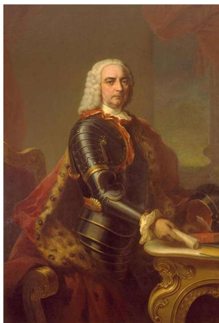
Jacques Desandrouin © Musée Théophile Jouglet, Anzin

Son évolution d'est en ouest s'accompagne d'une exploitation de plus en plus profonde. Si les puits de l'est ne descendent guère au-delà de 500 m, les puits les plus profonds sont creusés dans la région de Lens jusqu'à 1200 m.